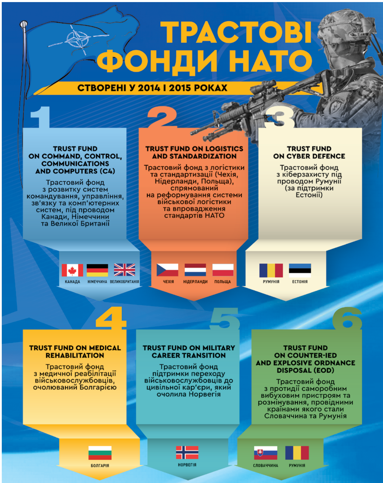
Інфографіка 1. Трастові фонди НАТО